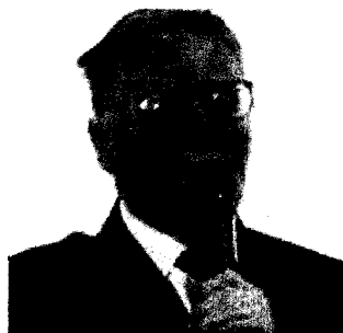
Giorgio Barberi Squarotti

Club Italiano e fondatore del premio - grazie agli interventi dell'Unione Parmense degli Industriali e di Cariparma».