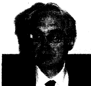
Roberto De Mattei